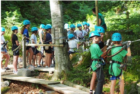
Seilpark Ausflug, nichts für schwache Nerven.

Während einige Klettern am Felsen ausprobierten, konnten andere mit dem Schlauchboot auf dem Bergsee herumpaddeln. Mit verschiedenen Challenges, die in kleinen Gruppen erledigt werden mussten, lernten sich die Kinder und ihre Gruppenleitenden am ersten Abend schnell kennen. Durch die ganze Woche verteilt, gab es immer wieder Action aber auch erholsame Programmpunkte wie die Erholung im Hot-Pot oder Freundschaftsbändeli knüpfen. Im Megalager ist für jedes Kind das passende dabei.