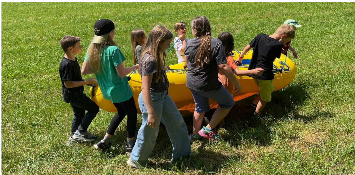
Schlauchbootchallenge bei der Olympiade im Kids

1 Dauer der Angebote oder Aktivitäten in Stunden 2 Anzahl TeilnehmerInnen während des Angebots 3 Anzahl der von Freiwilligen geleisteten Stunden